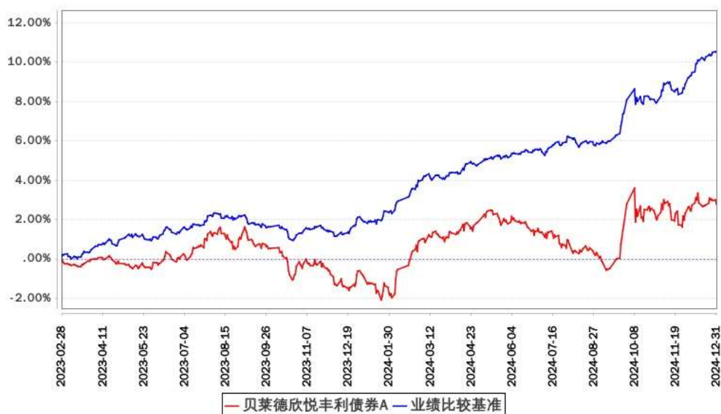
贝莱德欣悦丰利债券A累计净值增长率与同期业绩比较基准收益率的历史走势对比图